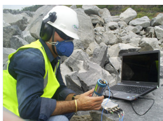
PASSO 2 Calibração e Medição com Analisadores de vibração