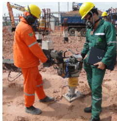
PASSO 3 Compilação de dados e Análise dos Resultados