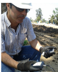
PASSO 1 Normas, Funções e Processo de medição

Esta área demanda de grande conhecimento técnico do instrutor em metrologia, análise e processamento de sinais presentes nos cursos de acústica e vibrações da Engenharia Mecânica e Instrumentação.